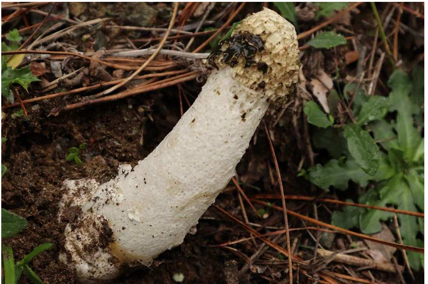
Phallus impudicus