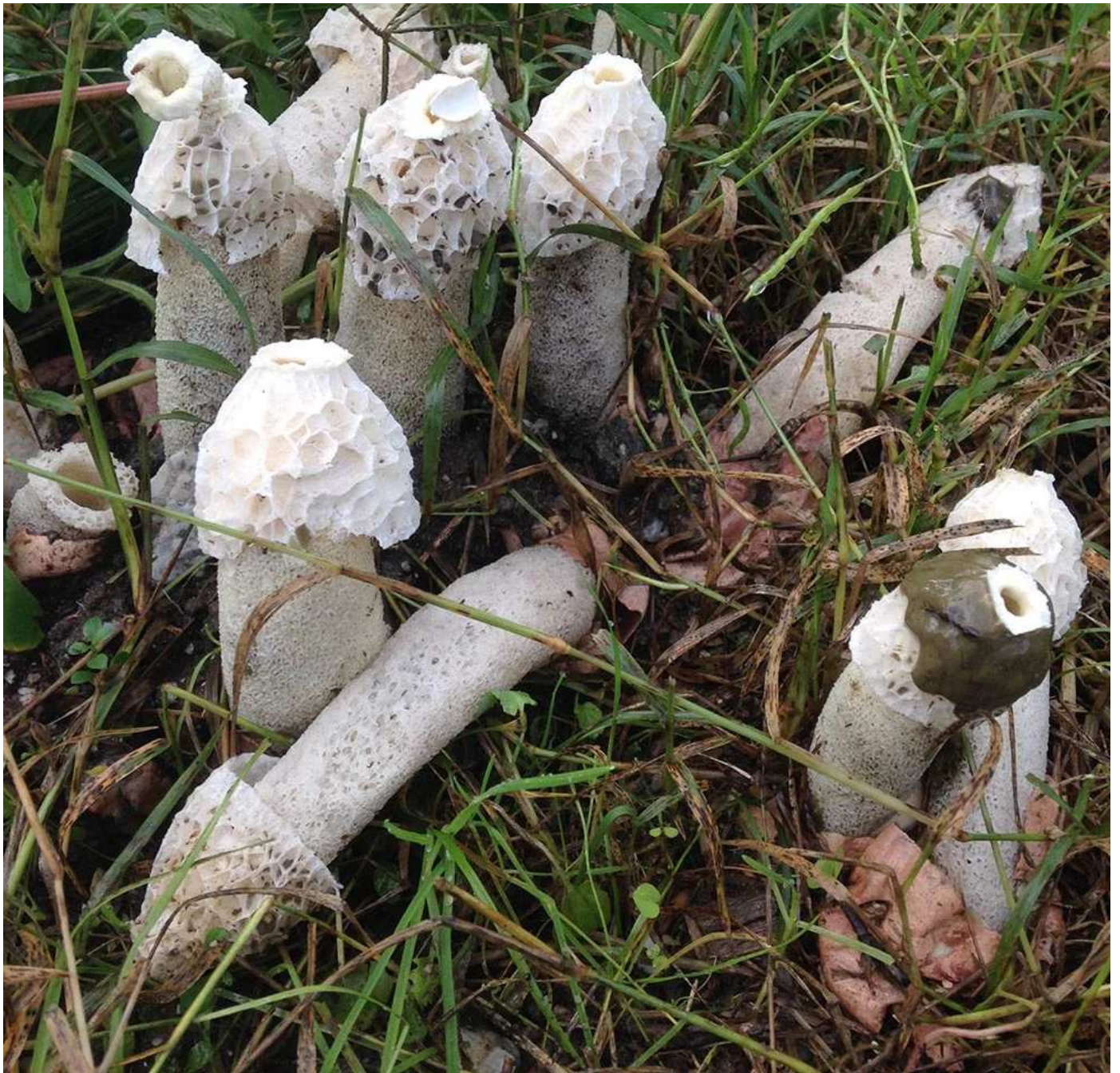
Phallus hadriani