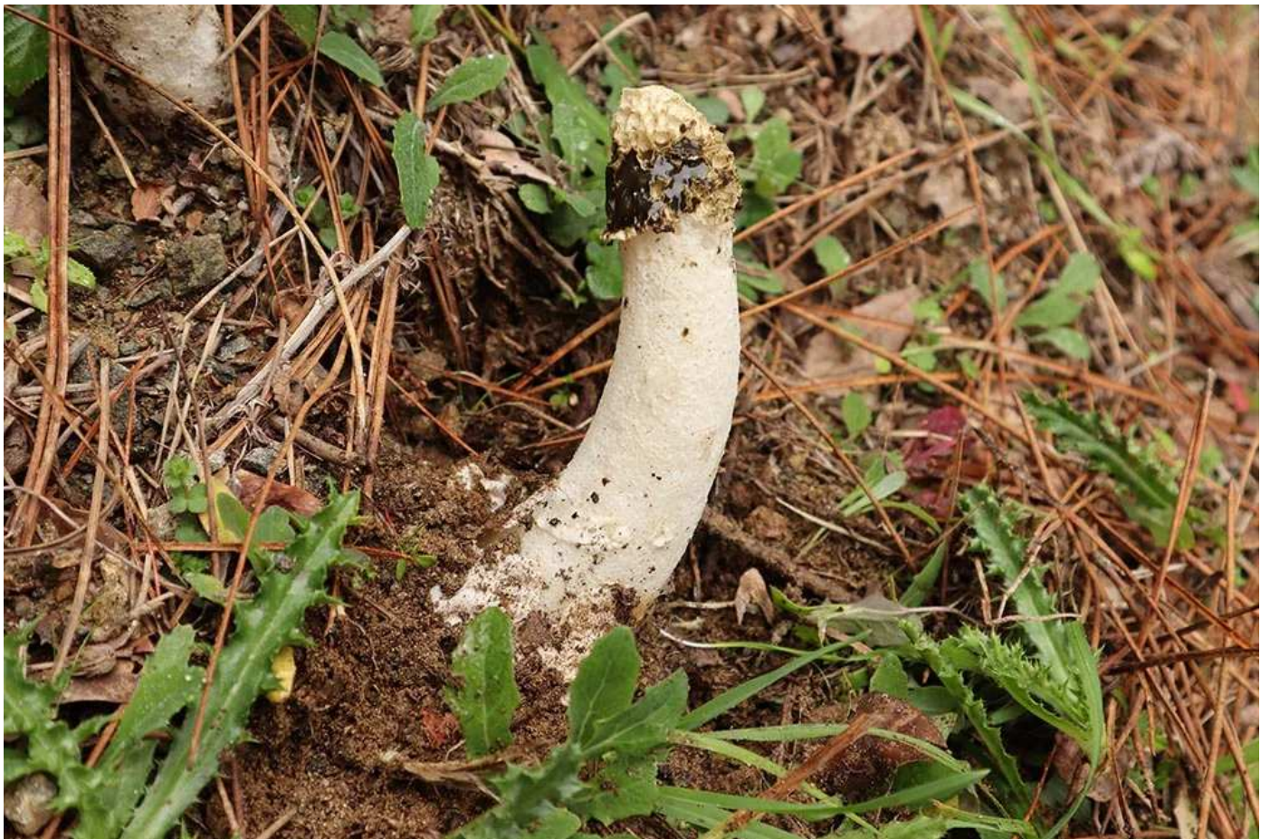
Phallus impudicus