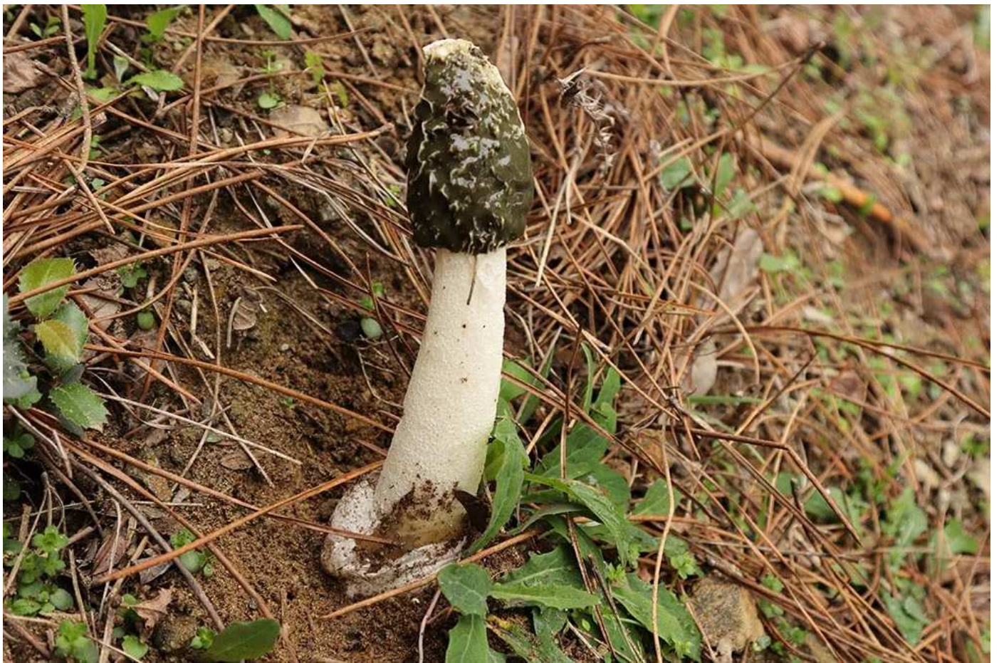
Phallus impudicus