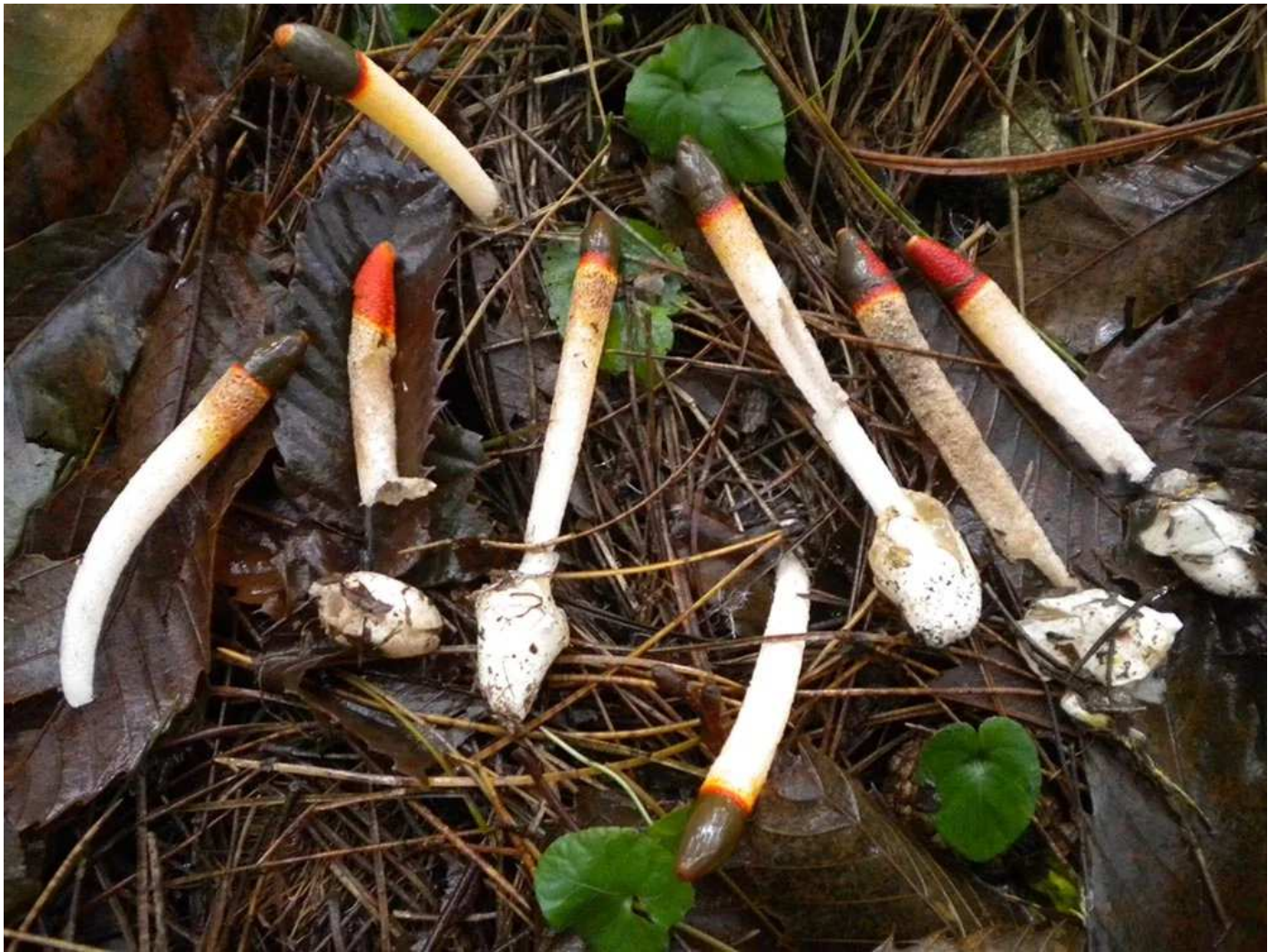
Mutinus caninus