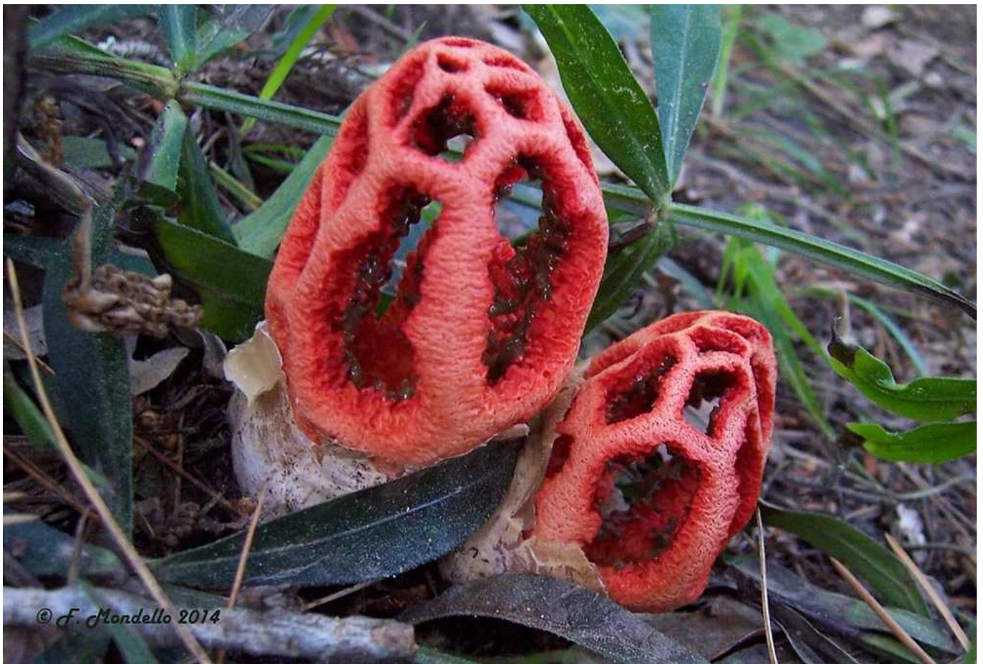
Clathrus ruber