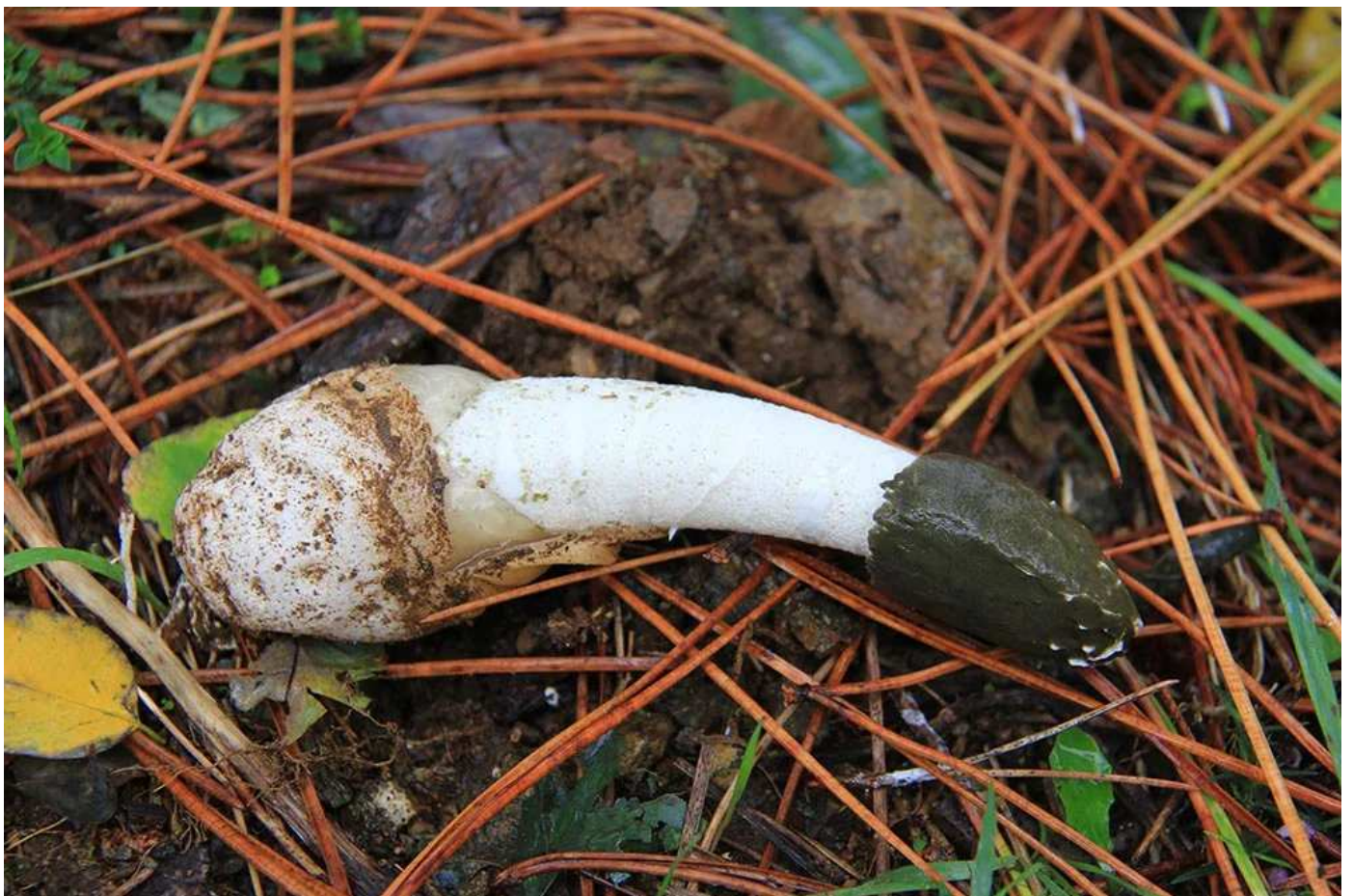
Phallus impudicus