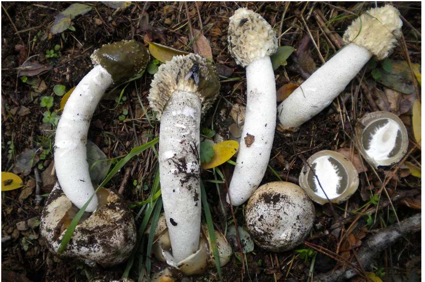
Phallus impudicus