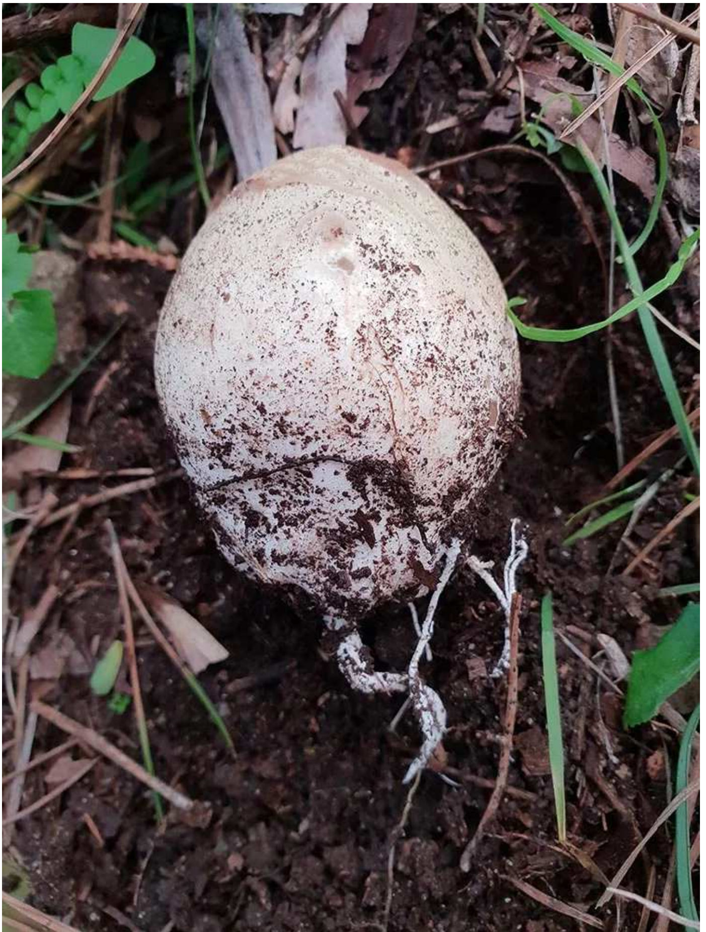
Phallus impudicus allo stadio di ovolo