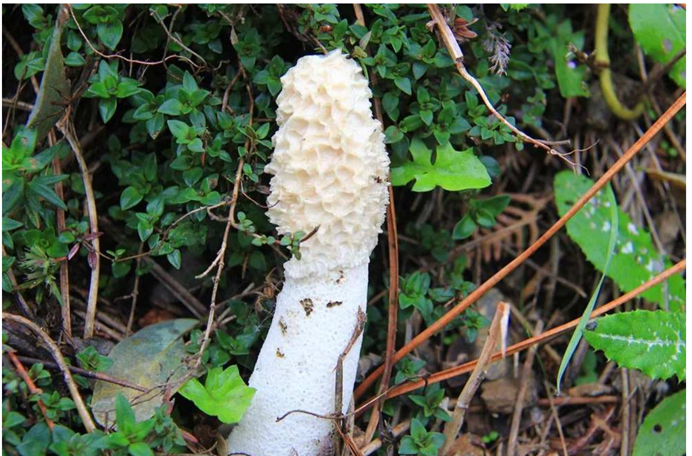
Phallus impudicus